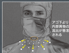
マスク・フード別構造