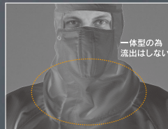
マスク・フード一体型構造