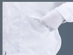
落下防止ポケット